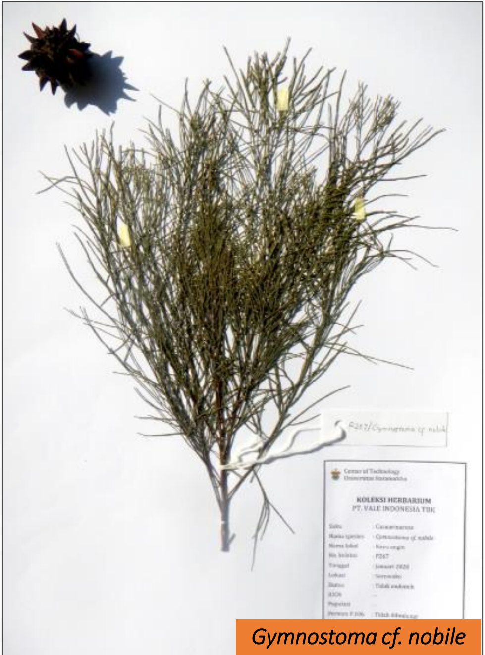
Gymnostoma cf. nobile